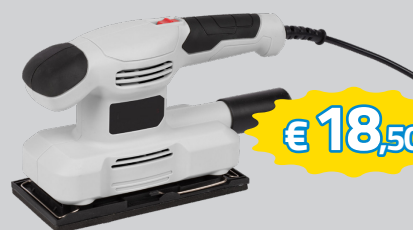
LEVIGATRICE ORBITALE 150W, PLATORELLO 187X90, SISTEMA AGGANCIAMENTO RAPIDO CARTA ABRASIVA ART.POWC40100