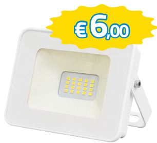
FARETTO LED BIANCO 220V 10W 6000K ART.930160