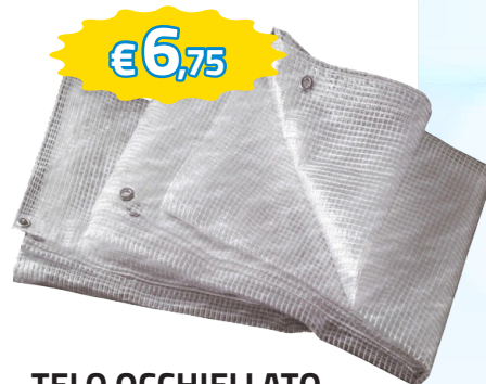
TELO OCCHIELLATO CON RETINATURA INTERNA 150GR/MQ 3X3 ADATTO COME PARETE PER GAZEBO ART.75/41