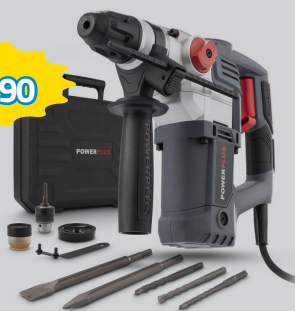
MARTELLLO DEMOLITORE 4.2 JOULE IN VALIGETTA COMPLETO DI 3 PUNTE SDS + 2 SCALPELLI. MANDRINO CON ADATTATORE SDS IN DOTAZIONE 900W ART.POWE10060