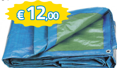
TELO GENERICO DI COPERTURA BICOLORE 70G/MC DIM.4X5MT CON OCCHIELLI SUL PERIMETRO ART.120191