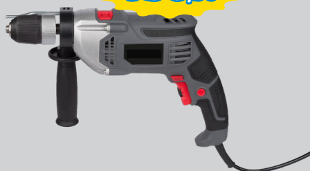
TRAPANO A PERCUSSIONE 950W CON PERCUSSIONE, REVERSIBILE. MANDRINO AUTOSERRANTE 13MM, VELOCITA' REGOLABILE ART.POWE10035