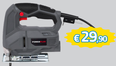
SEGHETTO ALTERNATIVO 450W ART.POWE30010