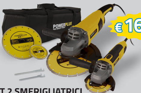
KIT 2 SMERIGLIATRICI 1 Ø MM.115 + 1 Ø MM. 230. 2 DISCHI OMAGGIO ART.POWX06250