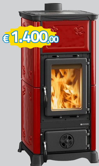
STUFA A LEGNA EMILIANA NORDICA 6.5 KW, RIVESTIMENTO CERAMICA, DIM.453X950X490 MM (LXHXP), SCARICO FUMI D.120MM, 5*