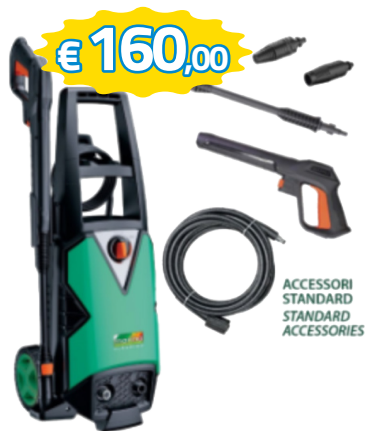
IDROPULITRICE MAVE CLEAN BOY 160-HL M/CE MARINA 2200W, 336L/H, 170BAR PER SPORCO TENACE ED UTILIZZI AD ALTA PRESSIONE ART.102412140