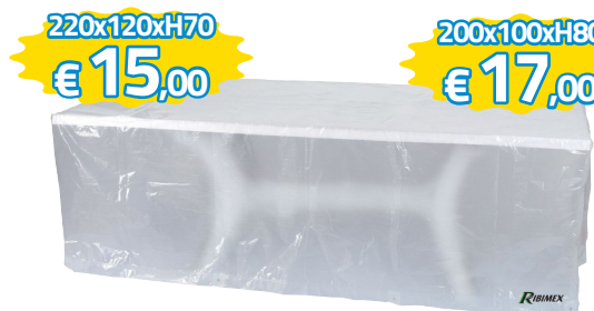
TELONE RETTANGOLARE SAGOMATO PER COPERTURA TAVOLO 220X120XH70CM - ART.PRH090220X120 200X100XH80CM - ART.PRH090200X101