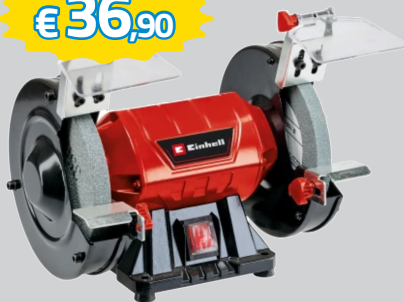
SMERIGLIATRICE DOPPIA DA BANCO. 150WATT DISCHI ABRASIVI 150X16 ART.PH150N