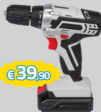
TRAPANO AVVITATORE REVERSIBILE, MANDRINO AUTOSERRANTE 10MM, LUCE LED FRONTALE, 1 BATT 12V 1.3AH + CARICABATTERIE ART.POWC1051