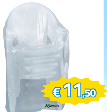
TELO SAGOMATO PER COPERTURA SEDIE C/BRACCIOLO 90X70XH115 ART.PRH09091X71