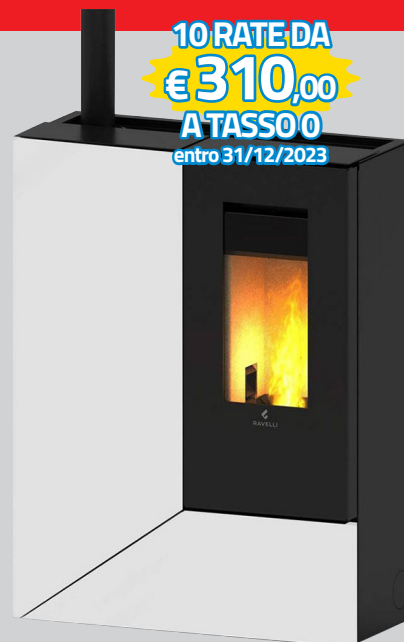
STUFA A PELLETT RAVELLI STILO BIANCA 11KW CON DOPPIA CANALIZZAZIONE 5*, RIVESTIMENTO STEEL, DIM. MM. 850X1150X350 (LXHXP)