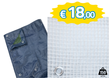
TELO OCCHIELLATO CON RETINATURA INTERNA, 150 GR/MQ 4X6 ART.75/44