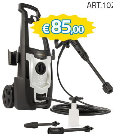
IDROPULITRICE POWERPLUS 1400W, 110BAR PER LAVAGGIO DELL'AUTO ART.POWXG90405