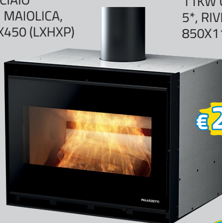
INSERTO A LEGNA ECOPALEX GTM70 PALAZZETTI 5*DIM. MM 620X500X500 (LXHXP), 9KW, SCARICO FUMI DIAM.150 ART.GTM70