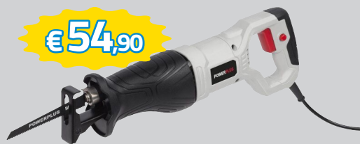
SEGA A GATTUCCIO 710W, CAPACITA' DI TAGLIO SUL LEGNO 115MM, SUL METALLO 5MM ART.POWC2060