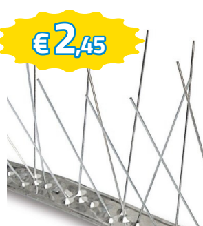
DISSUASORE INOX A SPILLI PER PICCIONI E VOLATILI BARRA 1MT ART.904