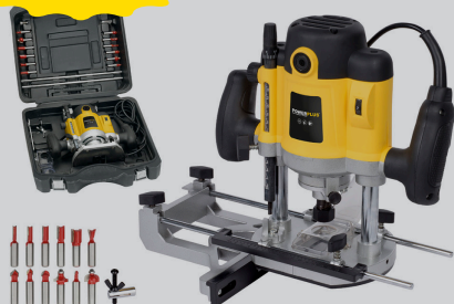
FRESATRICE VERTICALE 1500WATT IN VALIGETTA CON 12 FRESE ATTACCO 12MM ART.POWX093