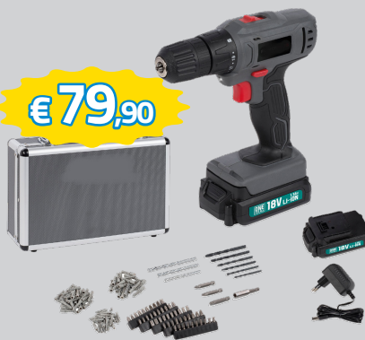
AVVITATORE REVERSIBILE COMPLETO DI 2 BATTERIE 18V 1.3AH, IN VALIGETTA CON 153 ACCESSORI ART.POWESET1