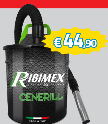
ASPIRACENERE CENERILL 1000W ART.PRCEN001

ROTTAMA LA TUA VECCHIA STUFA: RECUPERI IL 65% CON CONTO TERMICO E IL 50% CON BONUS CASA