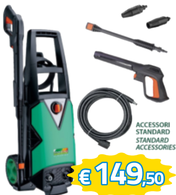
IDROPULITRICE MAVE CLEAN BOY 140-HL M/CE MARINA 1800W, 330 L/H, 145BAR EFFICACE PER PULIZIA DI PAVIMENTAZIONI ESTERNE, MURETTI CON SPORCHI RESISTENTI DI MUSCHI O SMOG ART.102412130