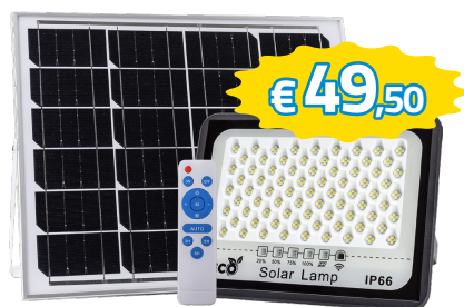
FARETTO LED 60W AD ENERGIA SOLARE IP65, BATTERIA 3.2/10AH, PANNELLO 6V/10W ART.62317