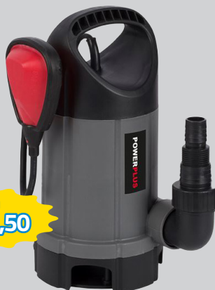
POMPA AD IMMERSIONE ACQUE SCURE 7500L/H, MT5 400W ART.POWEW67904