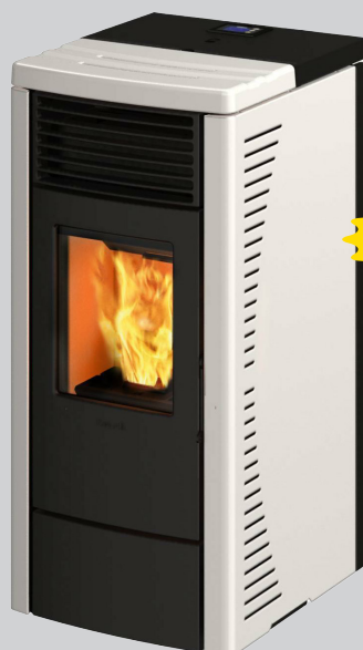
STUFA A PELLETT RAVELLI R70 7KW, FIANCHI IN ACCIAIO VERNICIATO, TOP IN MAIOLICA, DIM. MM. 440X950X450 (LXHXP)